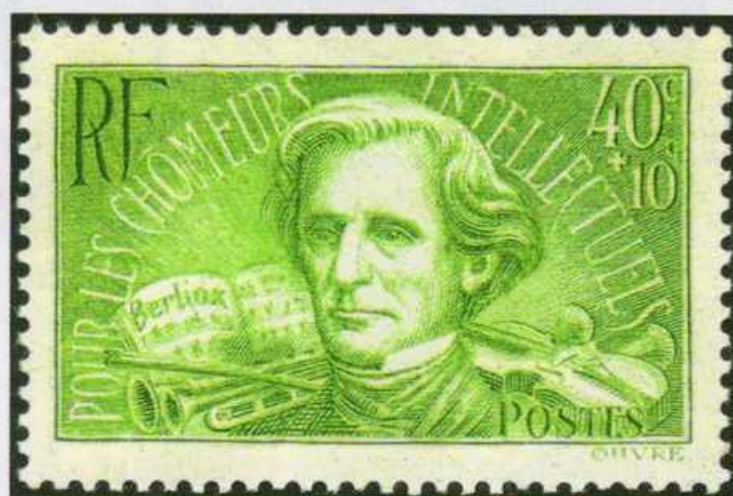
ベルリオーズ(1803-69) / 失業知識人救済付加金付き (フランス・1936年)

1830年に発表した《幻想交響曲》は、ベートーヴェンの《第九交響曲》以後の最大の傑作。大編成の管弦楽を駆使した標題音楽の手法は、のちのリストやワーグナーの手本となった。