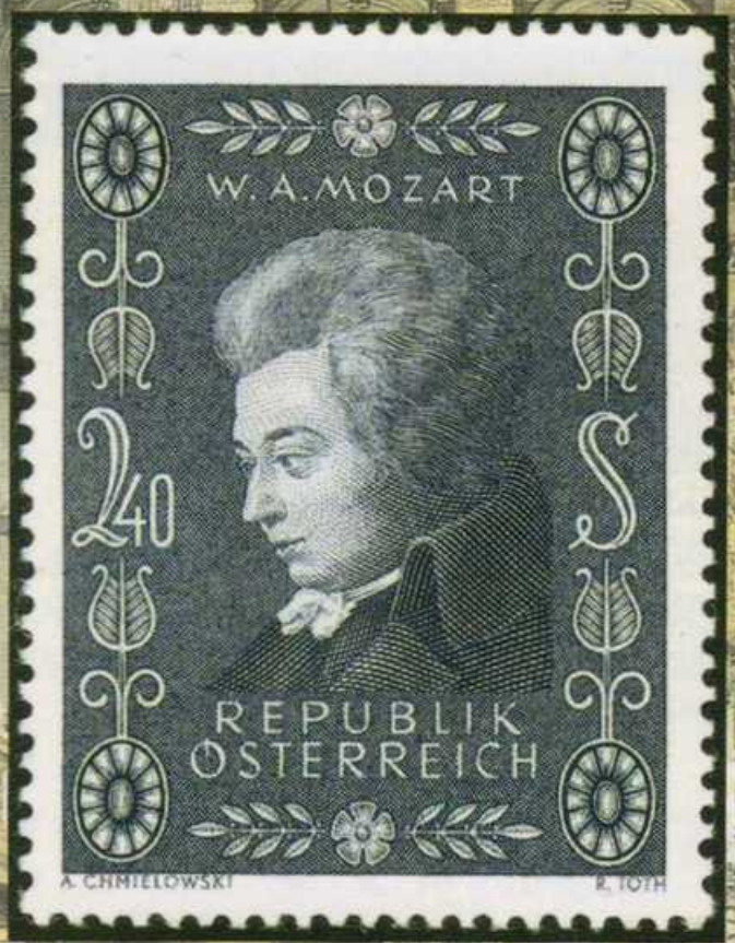
モーツァルト(1756-91)/生誕200年 (オーストリア・1956年)

数多くあるモーツァルト切手の中で抜群の人気を誇り、今回のアンケートでも堂々の第1位を獲得した。原画はモーツァルトの義兄ランゲが1789年ころに描いた油彩画で、顔の部分だけが完成し、あとは未完成だが、モーツァルトの肖像画としてもっともよく知られている。黒味がかかった青色単色の凹版印刷は格調高く、気品を感じさせる。