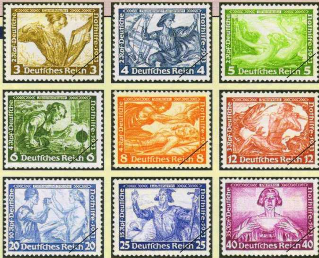
▲ワーグナーの舞台シーンを描いた「ワーグナー楽劇セット」9種。

この年の1月、ナチスは政権の座にいたが、ナチスにとって人種差別主義者のワーグナーは聖人となり、「楽劇セット」が題材になったのはそのためかもしれない。この9種の中には《神々の黄昏》がない。ヒトラーが1000年続くと豪語したナチス第三帝国にとって、黄昏はあり得ないから切手に取り上げられなかったという俗説もある。またハーケンクロ